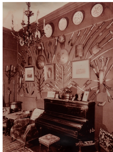
L'appartement de Prosper Holstein à Lyon